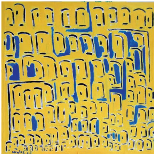
Walid: Gelbe Stadt / Acryl

ZUM DANK EINEN QUADRATMETER KUNST ! DAS KÖNNTE IHR KUNST-m 2 SEIN!