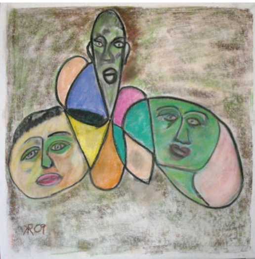
Rolf: Fantasien / Kreide